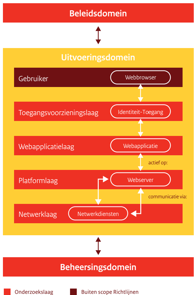
Figuur 2. Indeling van de beveiligingsrichtlijnen

De beveiligingsrichtlijnen zijn, naar de gelijknamige domeinen, georganiseerd in drie hoofdstukken: beleidsdomein, uitvoeringsdomein en control- of beheersingsdomein. Deze indeling komt voort uit het SIVA-raamwerk. Figuur 2 geeft de indeling van de richtlijnen.